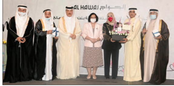
خلال حفل ختام برنامج عيد الأم وبرعاية وزيرة الصحة