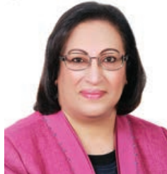
○ وزيرة الصحة.

ترأست فائقة بنت سعيد الصالح وزيرة الصحة الاجتماع الأول لعام ٢٠٢٢ للجنة الوطنية لمكافحة التدخين والتبغ بأنواعه ومنتجاته والذي عقد يوم الأحد الموافق ٢٧ مارس ٢٠٢٢. وذلك بحضور الوكيل المساعد للصحة العامة الدكتورة مريم الهاجري وبمشاركة كل أعضاء اللجنة. وفي مستهل أعمال الاجتماع رحبت سعادة وزيرة الصحة بأعضاء اللجنة